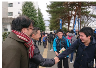
右：握手でパワー注入！