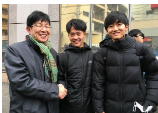
左：校長先生も激励に！

18日、19日に実施された最後の大学入試センター試験。例年になく穏やかな天候の中、本校生徒たちは無事に受験を終えました。気になる本校の自己採点結果ですが、文系が652.6点、理系で608.4点の平均点でした。昨年よりやや難化と予想が出る中、理系は大健闘をみせ、文系は昨年を上回る結果をみせました。後は、保護者や担任とよく相談して納得のいく出願をしてください。これから3月の末まで2ヶ月間の道のりです。諸君それぞれの進路目標の達成へ向けて前進あるのみです。授業を中心としてしっかりと個別試験対策をおこない、私立大、中期、後期試験も含め最後まで頑張りましょう。