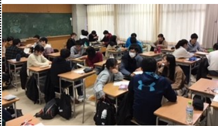
グループディスカッションの様子

ネットいじめの怖さを改めて実感しました。自分が相手に嫌な思いをさせてしまってからでは遅いので、相手の顔が見えないSNSでも常に相手の立場に立って接すること、また、誤解を解くのはとても難しいことだと思うので常に自分の言動を客観視することを意識したいです。